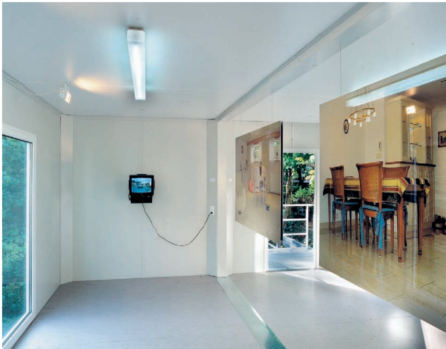
Ausstellung „passato betonato & mobile homes“ von Studio Düsburg im Containerturm